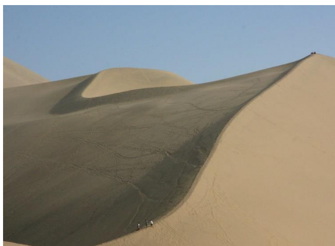
Désert de Gobi - dunes de sable des environs de Dunhuang