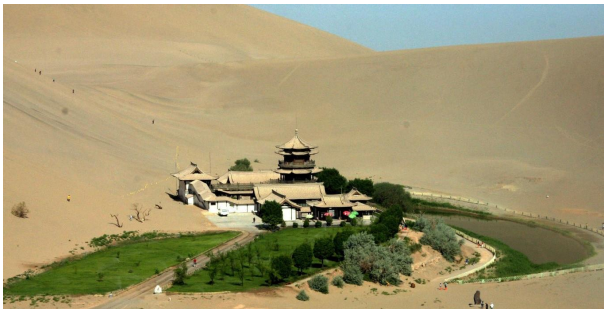
Le lac du croissant de lune au milieu des dunes de sable

Afin de situer les lieux, vous trouverez ci-dessous des photos prises par Alain Caporossi, le Président de l'association franc-comtoise des amitiés franco-chinoises, en 2007, lors de deux voyages organisés par l'association sur le thème des « Routes de la soie ».