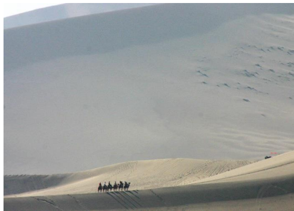
Désert de Gobi Dunes de sable des environs de Dunhuang (Alain Caporossi 2007)