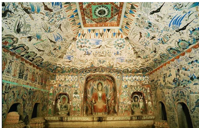
Intérieur d'une grotte de Mogao